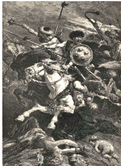
Die Hunnen in der Schlacht auf den Katalanischen Feldern (Alphonse de Neuville, 1882)