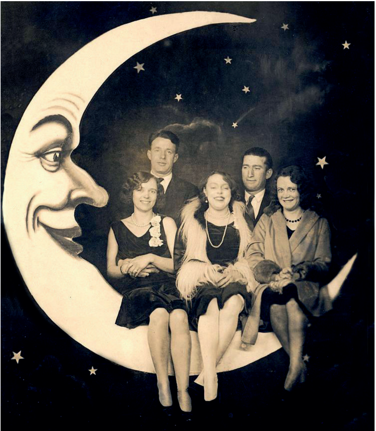
Zwei Kettenhändler mit ihren Damen: »Sterngucker – Sterngucker – nimm dich in acht – «