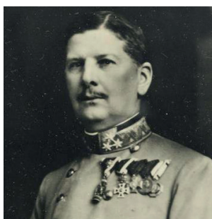
General Viktor Dankl* | General Auffenberg*