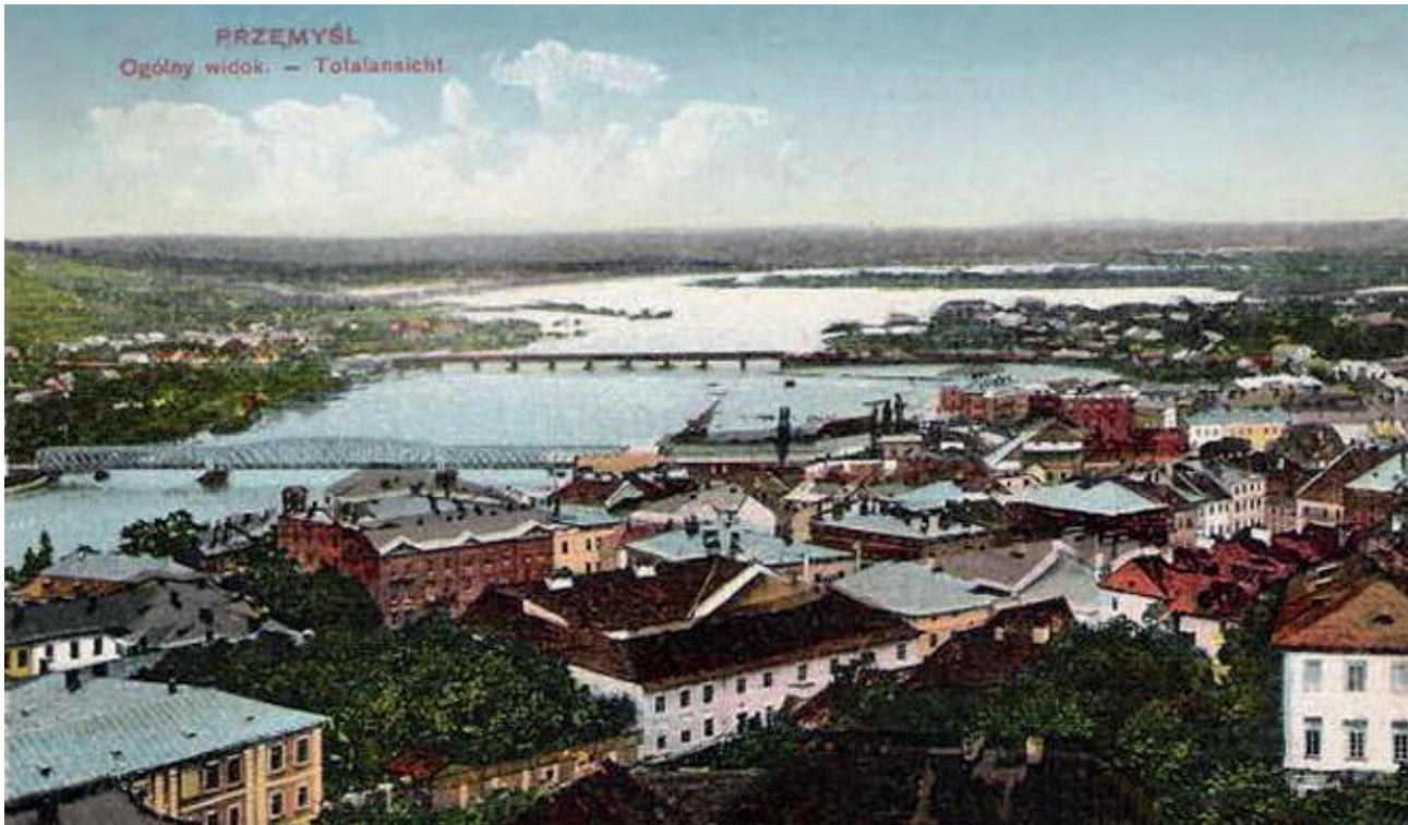
Przemyśl – Standort des Hauptquartiers im August 1914