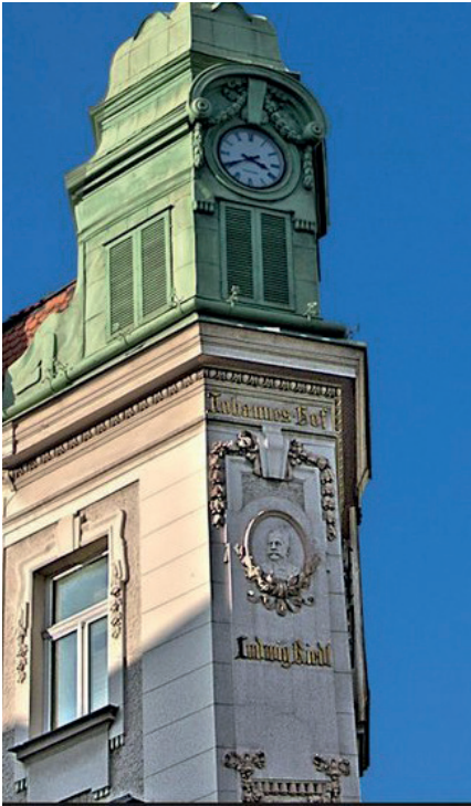
Ludwig Riedls Relief am Johanneshof