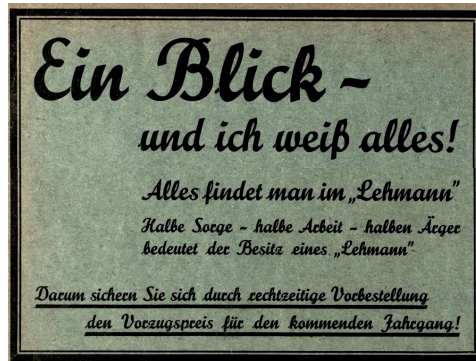
Lehmans allgemeiner Wohnungs-Anzeiger