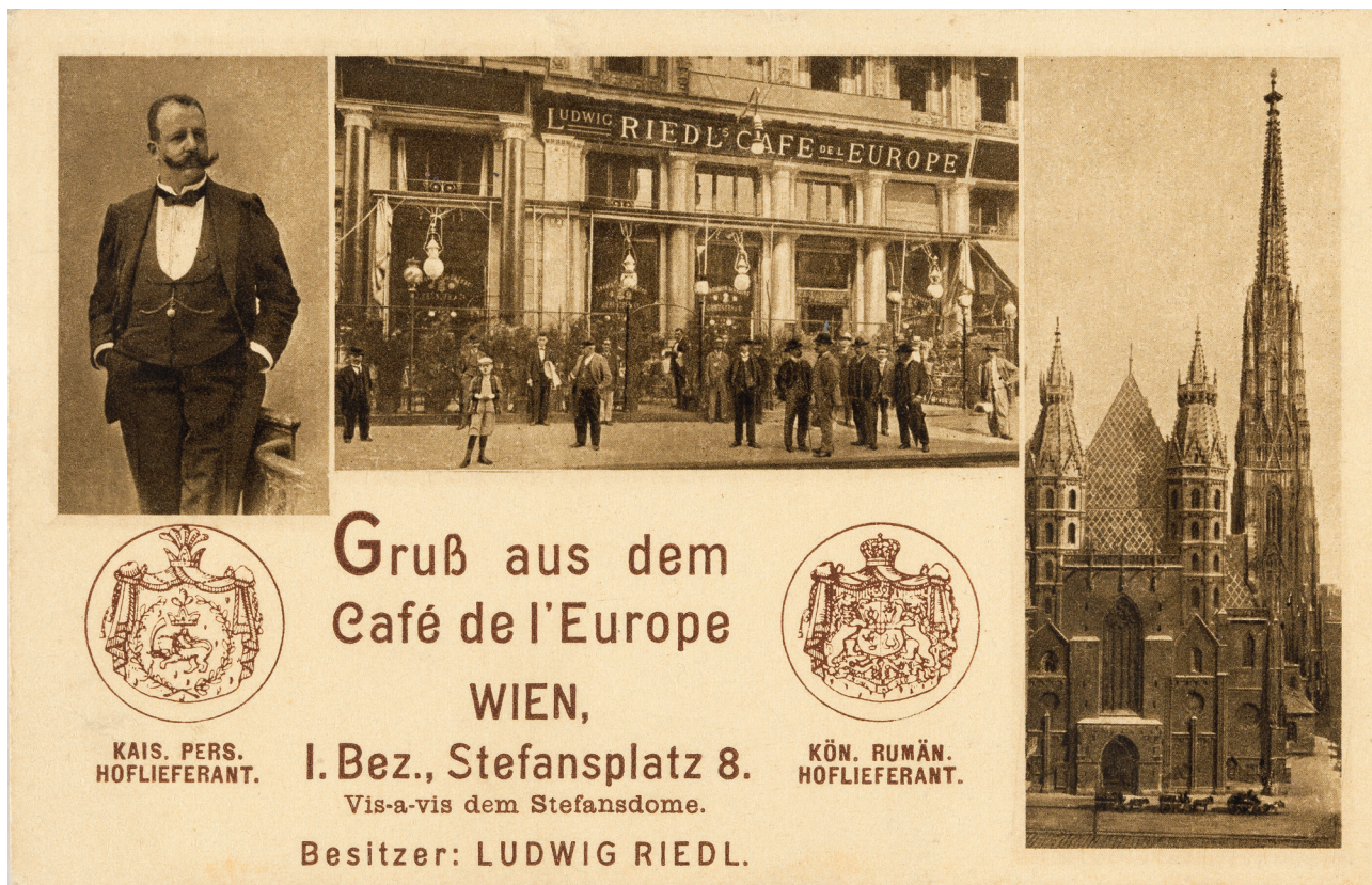
Grußpostkarte des Café de l'Europe mit Bildnis des Besitzers