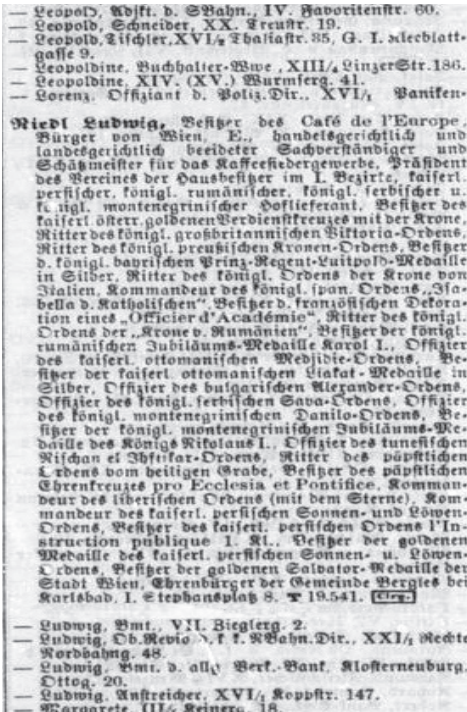
Riedls umfangreicher Eintrag im »Lehmann« (1914)