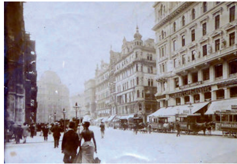
Café de l'Europe am Stephansplatz