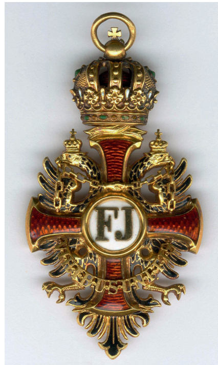
Franz Joseph Orden