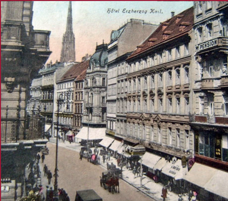
Kärntnerstraße 31 mit Hotel Erzherzog Karl und Wäschegeschäft »Zur englischen Flotte«

DER BEZUG ZUM FEINDLICHEN AUSLAND bei den »unter den Kriegsverhältnissen höchst unpassenden und daher auch ganz ungehörigen Firmenschildern und Geschäftsnamen« wurde am 28. Februar 1915 in einem Leserbrief an das »Deutsche Volksblatt« beklagt. Konkret bezog man sich auf das Herrenmodengeschäft mit dem Namen »Zur englischen Flotte« in der Kärntnerstraße. Dessen Geschäftsschild wurde trotz »sehr lebhafter Bewegung« in der Bevölkerung nicht entfernt, das Wort »englische« nur so notdürftig überklebt, dass es für die Passanten immer noch deutlich sichtbar war. Für die Bevölkerung war es unbegreiflich, wie man den »perfidesten und infamsten Kriegsgegner, den Österreich-Ungarn und Deutschland jemals hatten«, in Zeiten des Krieges immer noch eine solche öffentliche Ehrung erweisen konnte.