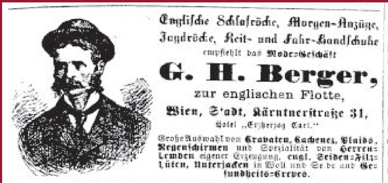
Annonce des Herrenmodengeschäfts »Zur englischen Flotte« auf der Kärntnerstraße

DER BEZUG ZUM FEINDLICHEN AUSLAND bei den »unter den Kriegsverhältnissen höchst unpassenden und daher auch ganz ungehörigen Firmenschildern und Geschäftsnamen« wurde am 28. Februar 1915 in einem Leserbrief an das »Deutsche Volksblatt« beklagt. Konkret bezog man sich auf das Herrenmodengeschäft mit dem Namen »Zur englischen Flotte« in der Kärntnerstraße. Dessen Geschäftsschild wurde trotz »sehr lebhafter Bewegung« in der Bevölkerung nicht entfernt, das Wort »englische« nur so notdürftig überklebt, dass es für die Passanten immer noch deutlich sichtbar war. Für die Bevölkerung war es unbegreiflich, wie man den »perfidesten und infamsten Kriegsgegner, den Österreich-Ungarn und Deutschland jemals hatten«, in Zeiten des Krieges immer noch eine solche öffentliche Ehrung erweisen konnte.